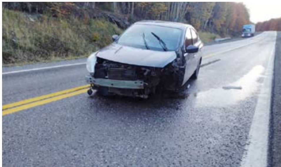
Tres integrantes del área de Salud, protagonizaron un accidente de tránsito en el paraje Rancho Hambre, y por fortuna todos salieron ilesos.