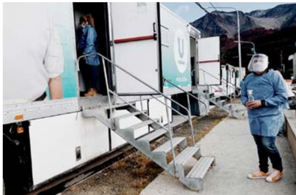
El equipo municipal de Políticas Sanitarias desplegó una logística que permitió que los vecinos y vecinas puedan ser atendidos de forma rápida y respetando los protocolos, aún con un número alto de casos a examinar.

Subrayó, además, que “esta metodología, permite que las personas puedan aislarse rápidamente, porque tienen el resultado en el mismo día de forma individualizada por teléfono y/o mail y de esa manera, se evita la circulación del virus en la ciudad”. Por último, Corradi agradeció “el trabajo comprometido que realizan quienes integran el equipo de salud, desde los encuestadores que reciben a los vecinos, hasta que el profesional le avisa el resultado. Hay un compromiso muy grande de la Municipalidad para evitar que la curva de contagios se dispare en nuestra ciudad, en esta segunda ola que estamos atravesando a nivel nacional”.