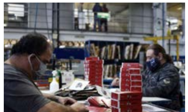
Micropymes y cooperativas podrán solicitar créditos directos.