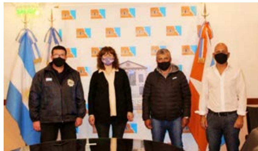
La Vicegobernadora Urquiza comentó que “la reunión básicamente tuvo como fin, presentarse y contarnos como gremio, cuál es su actividad central y la participación que ellos tienen en la actividad portuaria y de navegación, no solo en Ushuaia sino en varios puntos del país”.

neraría en la Provincia, la formación de mano de obra y empleo para los fueguinos y fueguinas”.