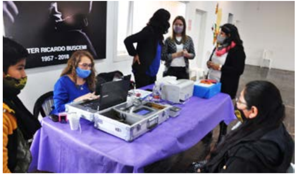
Los trámites se realizaron por orden de llegada y consistieron en DNI y Pasaporte Asimismo se realizaron trámites de actualización con la presentación de la Partida de Nacimiento de los interesados y los cambios de domicilio y documentación a menores de 14 años.