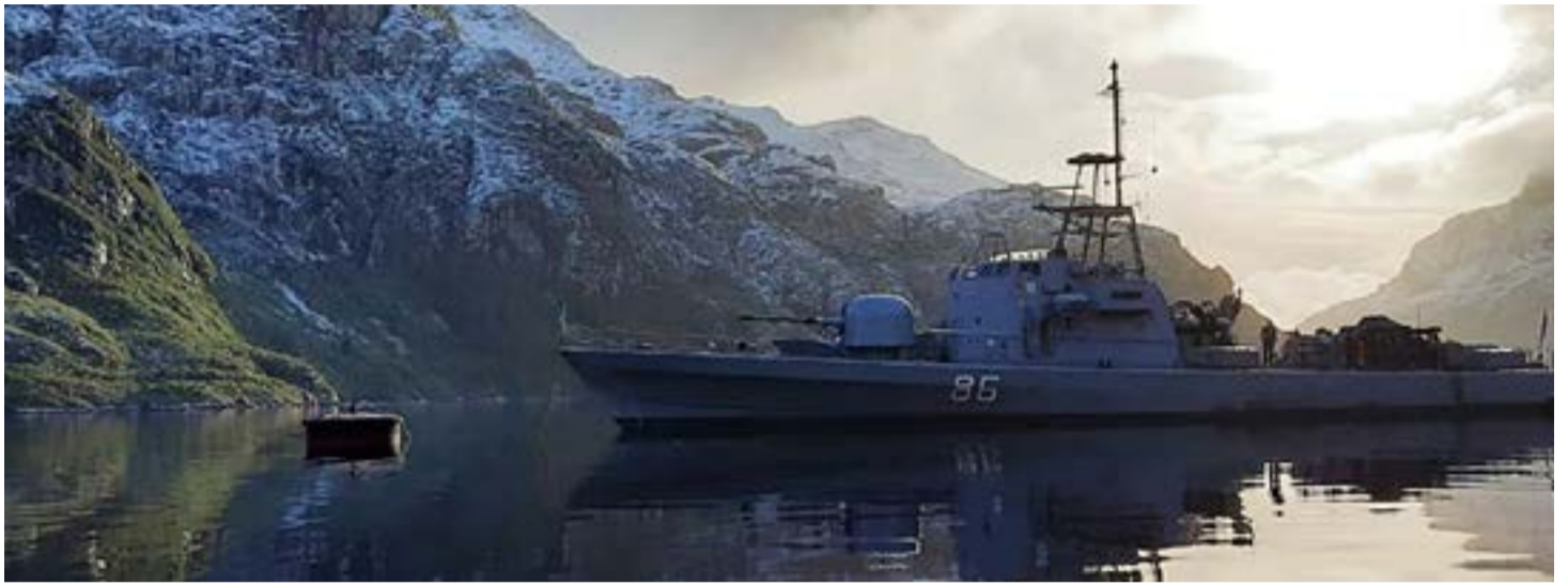
Desde el 2019, el joven marino mendocino se encuentra a bordo de la lancha rápida ARA “Indómita” desempeñando roles vinculados a la preparación de actividades operativas.