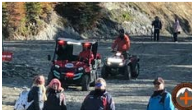
Un hombre se descompensó en el Glaciar Martial y debió ser auxiliado.

Rápidamente se lo evacuó hacia la base de operaciones, para luego trasladarse por sus propios medios, hacia el Hospital de la ciudad capitalina.