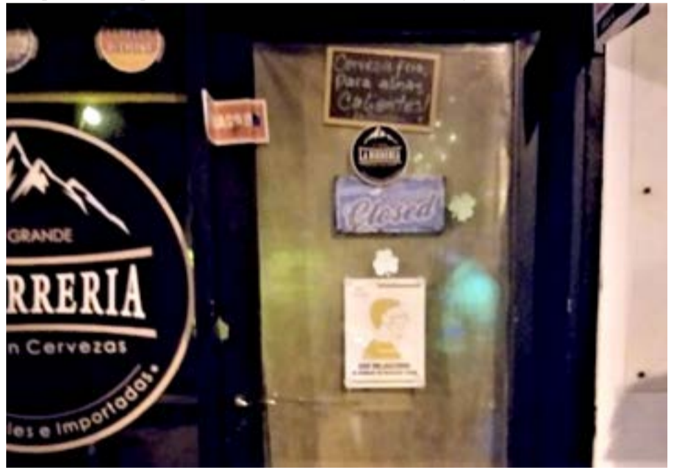
El Gobierno de la provincia clausuró una cervecería en Río Grande por incumplir el horario de cierre.

“Seguiremos realizando controles en toda la provincia y apelamos a la responsabilidad de los comerciantes y de los vecinos en general para cuidarnos entre todos”, concluyó.