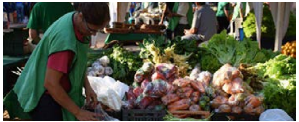
La brecha campo-góndola se redujo por segundo mes consecutivo, ubicándose en 4,29 veces en marzo.

Asimismo, los comedores escolares, comunitarios y merenderos recibieron $ 15.000 millones en todo el 2020 -un 200% más que en 2019- y, para 2021, hay presupuestado casi $14.000 millones.