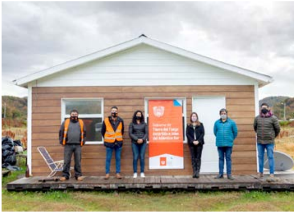
Operativo similar se llevó adelante en Almanza.