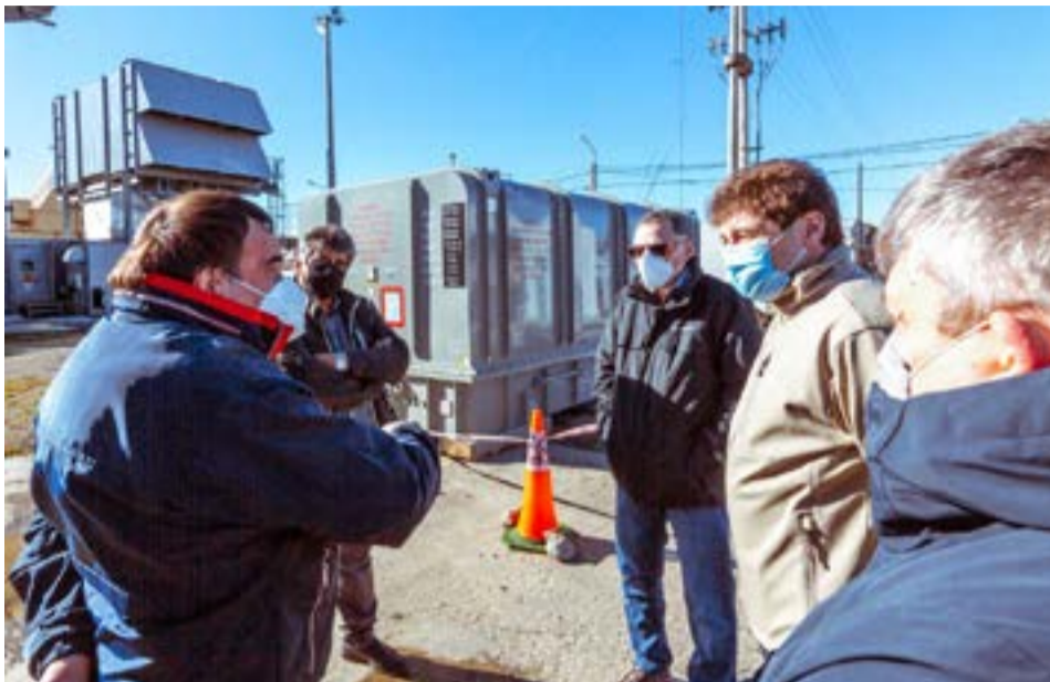
El Gobernador Melella evaluó que pensando en el crecimiento de la provincia y en la decisión política del Gobierno de seguir trabajando en la ampliación de la matriz productiva “será necesario contar con mayor energía” y agregó que “en el mismo sentido se está trabajando con la Dirección Provincial de Energía”.

cho el Gobierno de la provincia para garantizar un sistema estable, sostenible para la ciudad de Río Grande y de esta manera, junto a la Cooperativa Eléctrica, tener la respuesta para la solución en todos los aspectos del servicio tanto domiciliario como industrial”, subrayó la Ministra de Obras y Servicios Públicos.