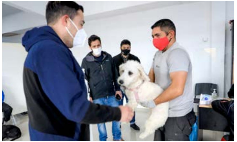
El Municipio de Río Grande, a través de la Dirección de Zoonosis, dependiente de la Secretaría de Gestión Ciudadana, llevó adelante una nueva jornada del programa "Castraciones Masivas en los Barrios".