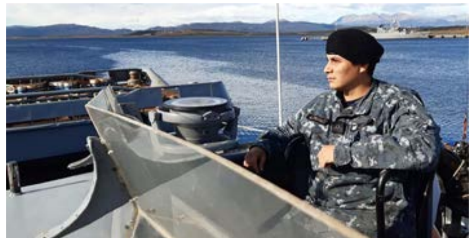
“Con el tiempo fui profundizando conocimientos sobre el tema y abocándome de lleno a la especialidad”, comentó el joven oficial.

Entre sus vivencias a bordo de la unidad destaca las navegaciones en el canal Beagle y las tareas de patrulla y adiestramiento. “También cumplimos los relevos de puestos de Vigilancia y Control de Tránsito Marítimo en Isla de los Estados y Bahía Buen Suceso”, detalló.