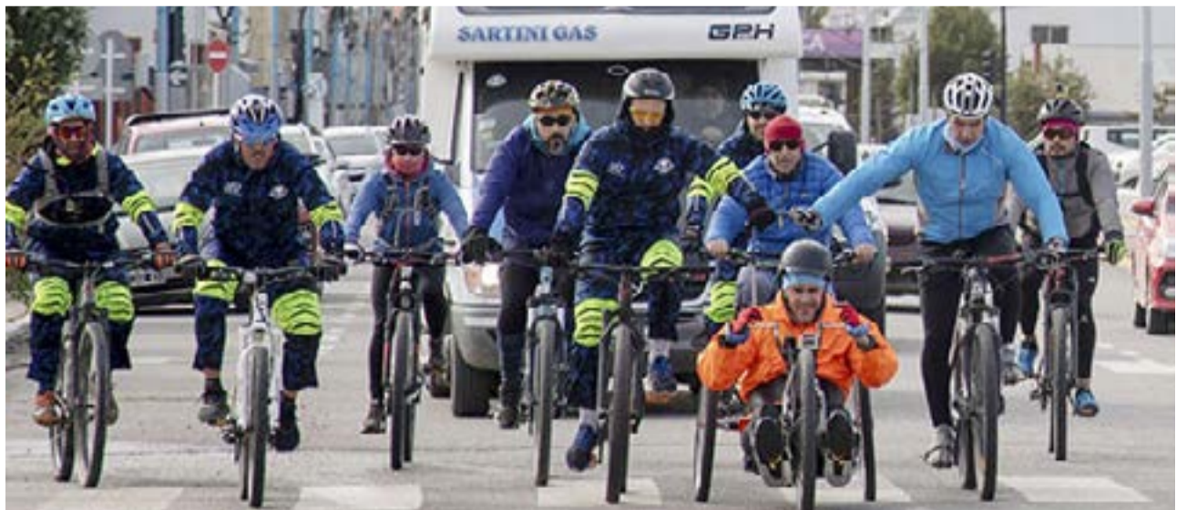
Cruzaron en caravana seis ciclistas con seis acompañantes, un jefe de logística, un kinesiólogo y un preparador físico.

Sobre el desafío, sentenció: “Esto es para que vean que en la condición que estoy, con una lesión medular, puedo ser independiente y manejarme por mi cuenta. Con