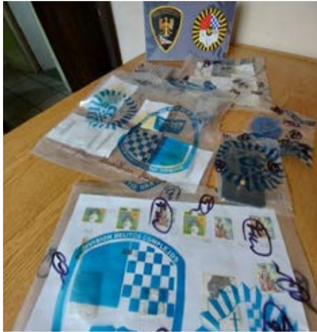
Una mujer que iba a visitar a un interno trató de ingresar a la Penitenciaría marihuana y LSD.

Producto de las investigaciones realizadas, el Juzgado Federal Ushuaia libró orden de allanamiento a un supermercado de la ciudad sobre calle Rivadavia esquina Gobernador Paz a fin acceder a los lockers del mismo, de donde se secuestraron un total de 716 dosis de ácido lisérgico (LSD) y elementos de interés para la causa.