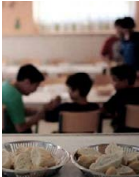
10 millones de argentinos y argentinas reciben asistencia alimentaria del Estado

Buenos Aires.- Mientras azota al país una segunda ola de Covid-19, Argentina todavía sufre las consecuencias económicas y sociales ocasionadas por la pandemia que llegó al país en 2020. En ese marco, millones de personas fueron alcanzadas por diversos programas sociales. Según el ministro de Desarrollo Social, Daniel Arroyo, un total de 45 millones de argentinos y argentinas, 10 millones reciben algún tipo de asistencia alimentaria del Estado.