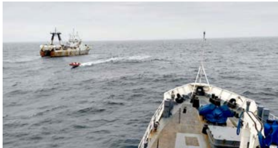
Igualmente se avanzó sobre la puesta en marcha del sistema de control y fiscalización satelital de la flota pesquera de altura que pesca en aguas de la provincia.