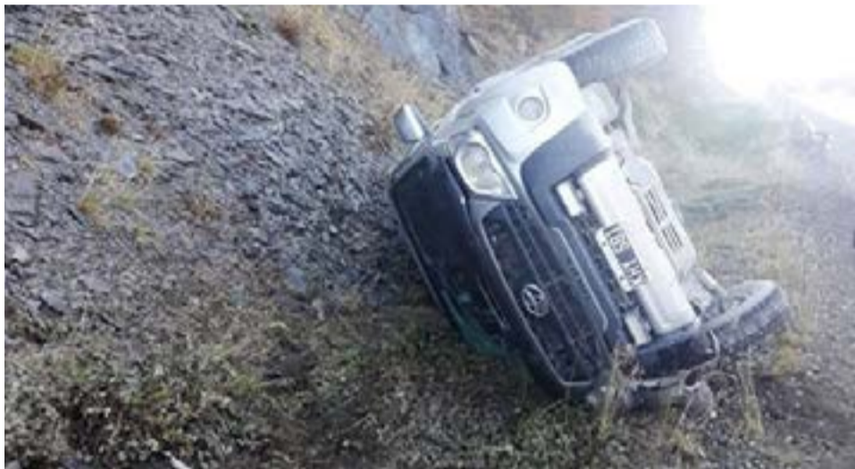
Una camioneta volcó sobre la ruta nacional 3 y un hombre resultó lesionado.

De igual modo, en el lugar, se presentó personal de Gendarmería Nacional, la unidad sanitaria y Defensa Civil Provincial.